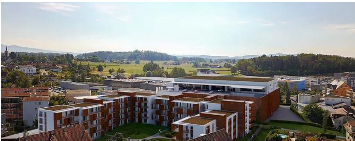
Grafik: Wohn- Gewerbepark Bubikon

Erstellen eines Prinzipschemas für den Bau der Energiezentrale.